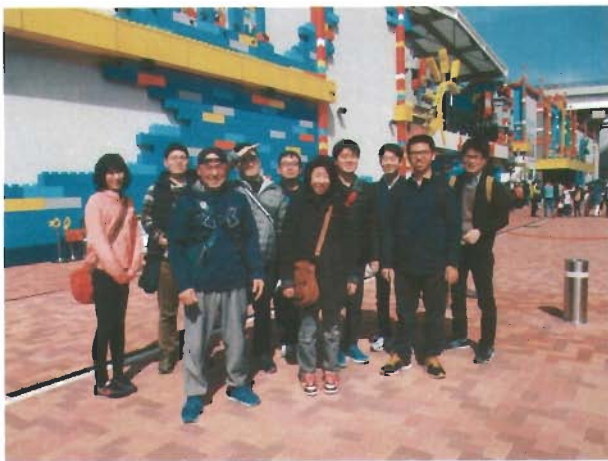
またジェットコースターに乗りたいたいね!

3月18日(日)に現利用者2名、就職者6名、職員3名でレゴランドへ行ってきました。雨が心配されていましたが、当日は晴れ、天気を気にすることなく、楽しむことができました。