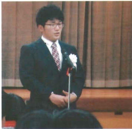
みんなの前でのスピーチ堂々としていました！

その後は参加者の皆さんと豪華な昼食を食べてホッと一息。午後からは音色アイランド、飛燕多治見の音楽とダンスで会場一体となり、けやきの利用者さんも加わってみんなで楽しく盛り上がる中、会は締めくくられました。