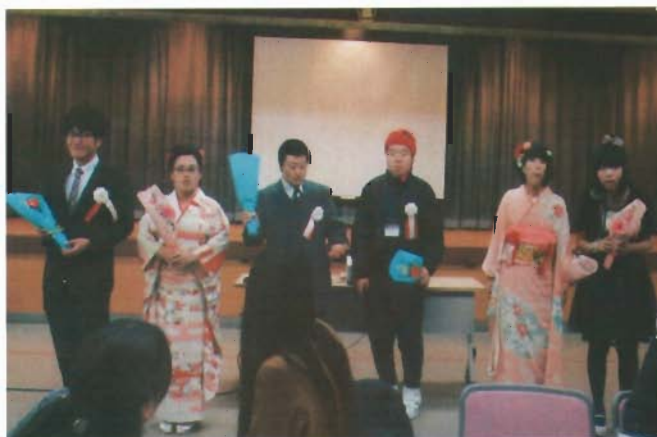
新成人になられたみなさんおめでとうございます！