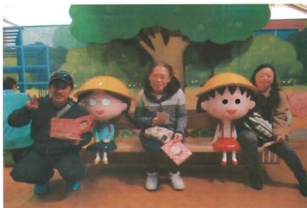
ちびまる子ちゃんと一緒に写真が撮れました！

3月11日(土)に第3けやきとけやき可児の利用者さん、22名と職員11名の総勢33名で、静岡県静岡市のエスパルスドリームプラザへ日帰り旅行へ行ってきました。行きバスの車内では、カラオケ大会を実施して皆さん好きな歌を楽しく歌って、長い移動の時間も短く感じました。