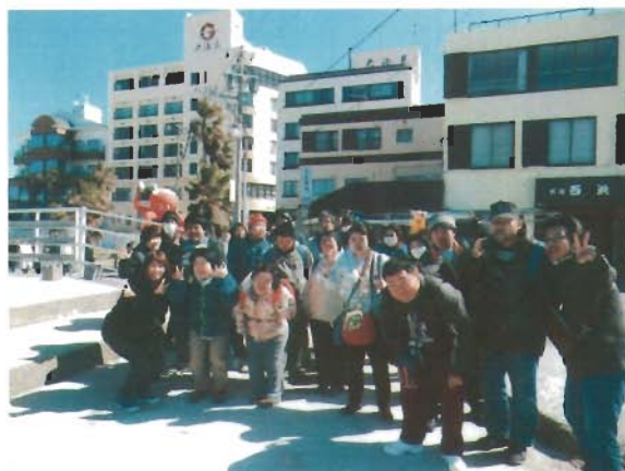
新鮮な食べ物が印象的でした!