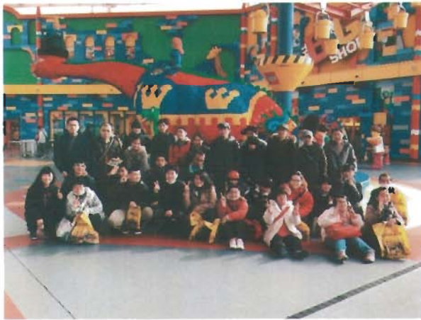
初めてのレゴランド楽しかったね!