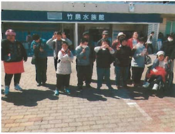
思い出に残る旅行になりました！

澤田農園のイチゴ狩りでは、甘くて大粒の美味しいイチゴを頼張り、思いのままに食べている皆さんの笑顔が印象的でした。