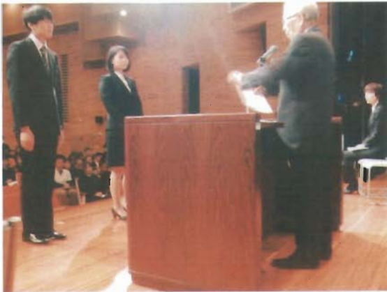
新入職員への辞令交付です

入社式は初めに法人みらいの理事長から30年度を迎えるにあたっての挨拶があり、続いて、新入職員の辞令交付、新しく4月からけやきを利用される利用者の方々の紹介と進んでいきました。