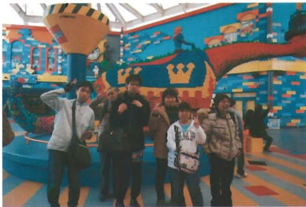
大きなレゴの前で記念写真！