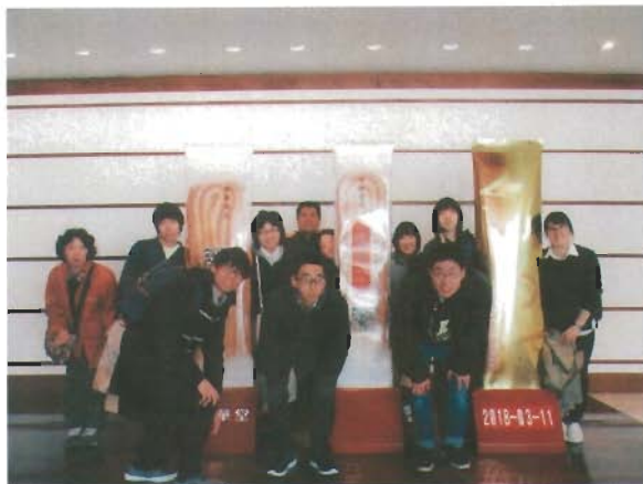
旅行でみんな気分リフレッシュ!

イチゴ狩りでは、大きなイチゴを見つける人、形の良いものを採る人、どれだけたくさん食べられるか挑戦する人など、思い思いに楽しむ様子が見られました。