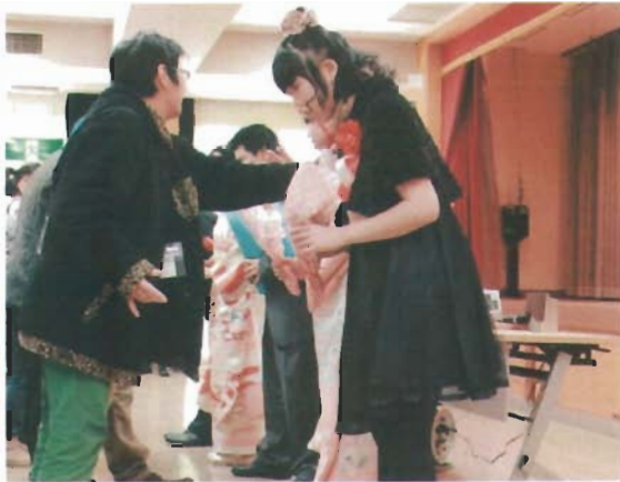
先輩から花束をもらって感激です

スーツ姿や着物姿もさることながら特に印象に残ったのが、新成人の皆さんの決意表明でした。当然緊張もある中、マイクを前にこれからはやきで頑張りたいことや、今頑張っていること、楽しみにしていることなど自分達の言葉でしっかりと話をしてくれました。またこれまで関わってくれた先生や職員、そしてご両親の言葉もしっかり届いたと思います。