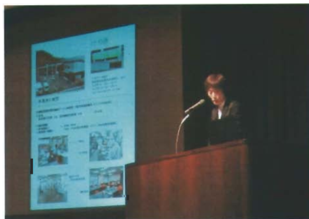
スクリーンを使い事業説明会を行いました

あっても、29年度から開設したけやき可児や豆腐事業のことはご存じでない方もお見えになられた様で、みなさん熱心に説明を聞いて下さいました。