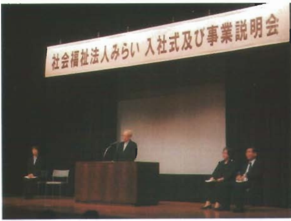
理事長から本年度の計画について説明の場面です

平成30年3月31日(土)に「入社式及び事業説明会」を行いました。昨年と同様に皆様にもっと法人の事を知って頂きたいという思いから、入社式だけでなく、他の事業所の事業内容や理念、将来計画等の説明を事業説明会として同時に行わせて頂きました。現在の法人みらいの事業内容や状況はなかなか皆様にご案内する機会がないので、知って頂く良い機会になればと思いました。