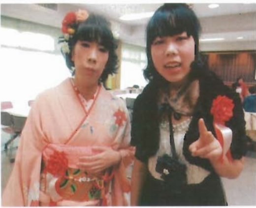
大人の装いで記念撮影です！

新成人が会場に入ると「カッコいい」「キレイだね」という歓声も上がりました。主役の6名も普段はなかなか袖を通す機会が少ない服装に照れながらも、大人の仲間入りを果たしました。